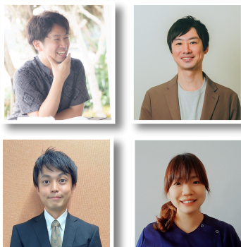
オンデマンド講師4講演