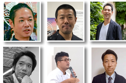
特別講義動画（各30分程）

オンデマンド講師の先生方は学会当日、現地に来場していただける予定となっています。当日講演していただく先生も合わせると総勢11名の「作業療法の第一線で活躍するエキスパート」が集結するかもしれません！！演題も前回学会以上の登録があり、まだまだこれからイベント・企画の発表も控えています。できればオンデマンド講演を視聴して現地にも足を運んでいただきたいと心から願っています。学会に参加して「楽しかった！」「明日から頑張ろう！」「挑戦してみよう！」と思えるような学会を作ります！ 2025年2月23日（日）JR博多駅でOT学会！！ よろしくお祈りします！